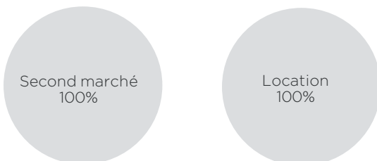
Segmentation de la demande placée

507 m 2 | 1 Transaction | Délai théorique d'écoulement du stock 37 mois